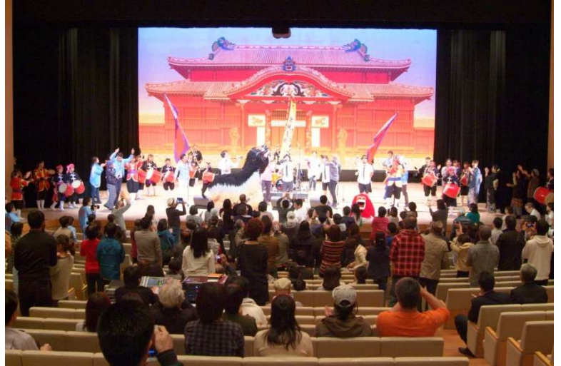
（前回 2017 年の様子）

現在、協賛企業、個人協賛を募っております。また実行委員としてお手伝いしたいという方々の参加もお待ちしております！